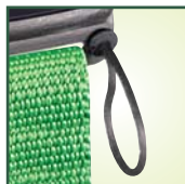
Dos (2) argollas de tirón para cuerdas de seguridad